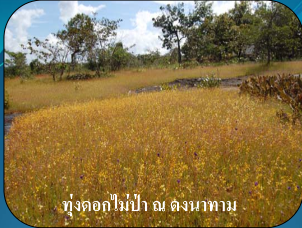
ทุ่งดอกไม้ป่า ณ ดงนาทาม