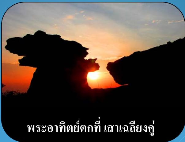
พระอาทิตย์ตกที่ เสาเจดีย์งู