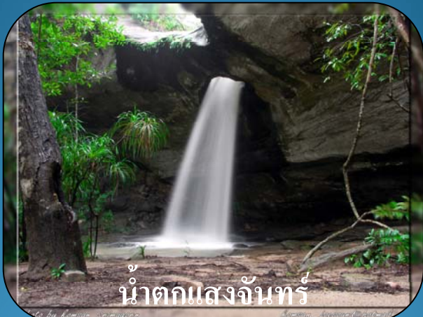
น้ำตกแสงจันทร์